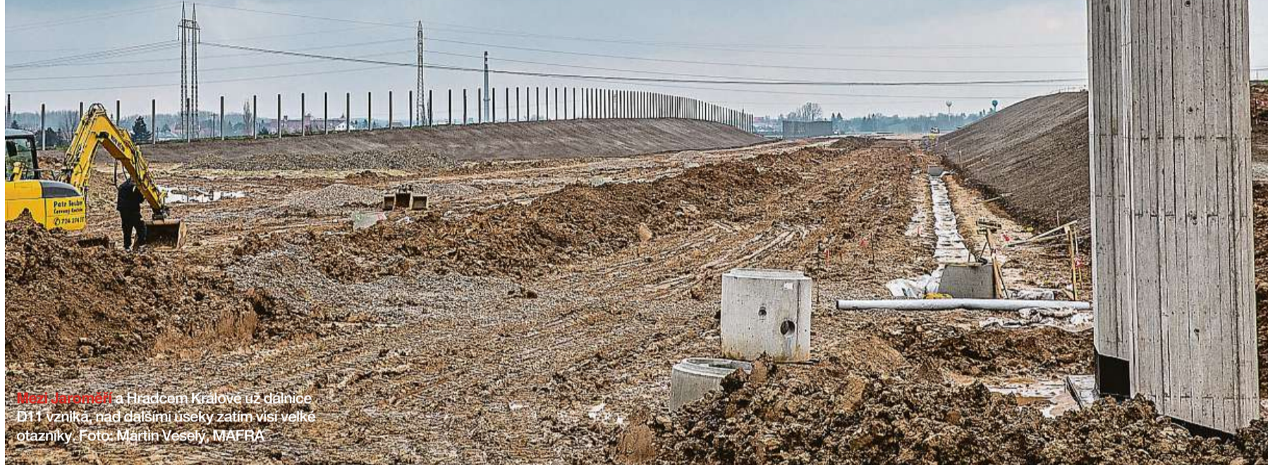
Nový Jaroměř a Hradcem Králové už dálnice D11 vzniká, nad dalšími úseky zatím visí velké otázky.

Pokud se naplní černý scénář a Poláci budou s dálnicí na hranici o pět roků dřív než Češi, povalí se na Trutnovsko mnohem více aut než dosud. Kritická situace by místo měsíců potrvála roky.